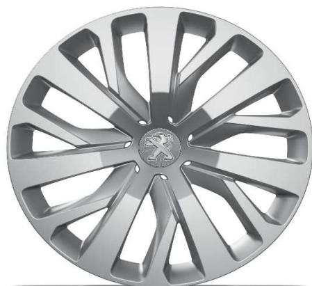
Serijsko na nivoju opreme ACTIVE PACK 16" jeklena platišča z okrasnimi pokrovi 'RAKIURA'