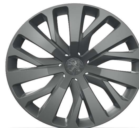
Serijsko na nivoju opreme ALLURE 16" jeklena platišča z okrasnimi pokrovi 'TONGARIRO'