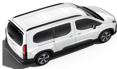
PRP0 - BELA ICY