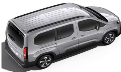
F4M0 - SIVA ARTENSE