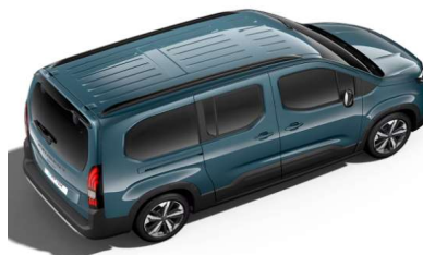
M6M0 - MODRA LIBECCIO