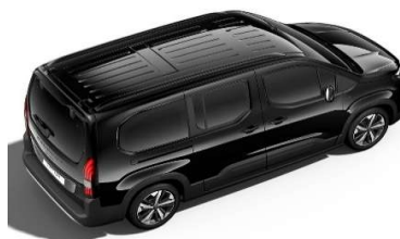
9VM0 - ČRNA PERLA NERA