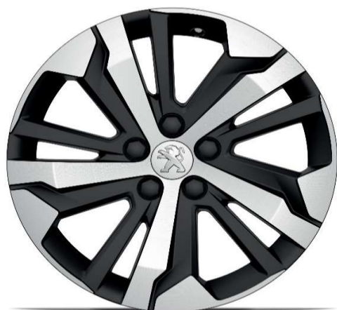
Serijsko na nivoju opreme GT 17" ALU platišča 'AORAKI'