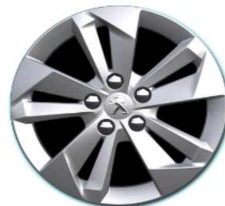
Opcijsko na nivoju opreme ALLURE 16" ALU platišča 'TARANAKI'