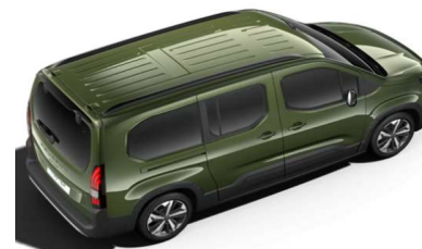
4QM0 - ZELENA KHAKI