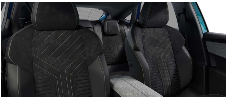
X0FX - Notranjost v kombinaciji TEP in alkantere Opcijsko na GT