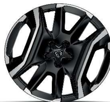
Serijsko na nivoju opreme ALLURE in GT BEV in PHEV ALU platišča 48,26 cm (19") 'LULEA'