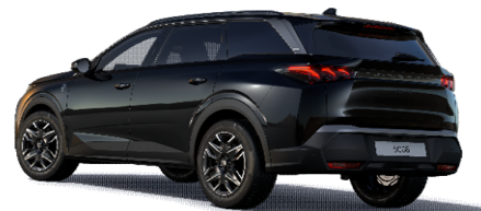
9VM0 - ČRNA PERLA NERA