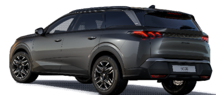
1JM0 - SIVA TITANE