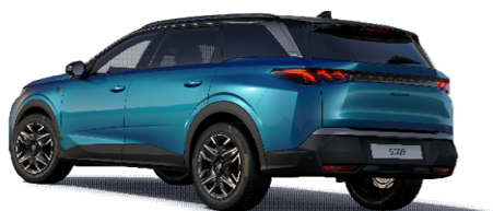
DPM0 - MODRA OBSESSION