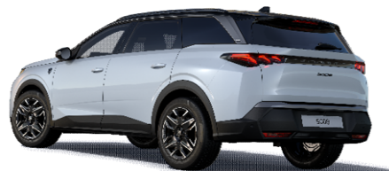
SUM0 - BELA OKENITE