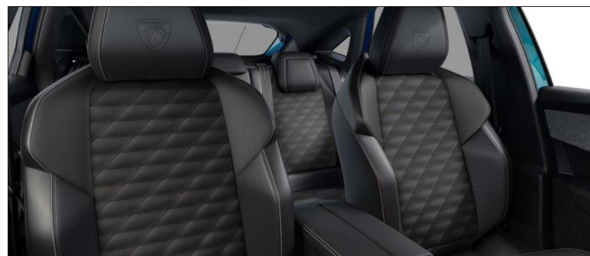
4HFX - Notranjost iz usnja 'Nappa' Mistral Opcija na E-5008 AWD