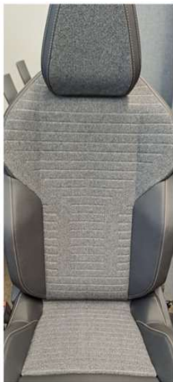
W6FX - Notranjost v kombinaciji TEP in tkanine CRISPY Serijsko na ALLURE