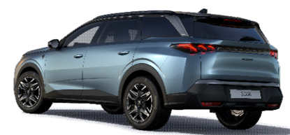
7KM0 - MODRA INGARO