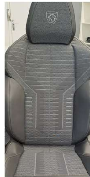
T5FX - Notranjost v kombinaciji TEP in tkanine UZIRIS Serijsko na GT