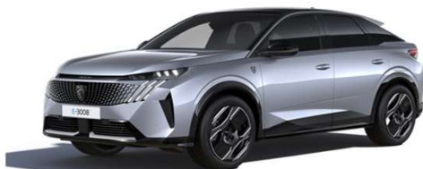
F4M0 - SIVA ARTENSE