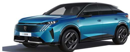
DPM0 - MODRA OBSESSION