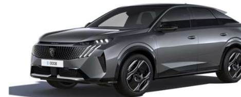
1JM0 - SIVA TITANE