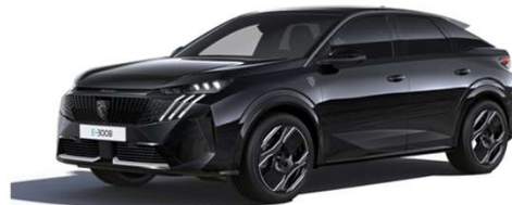
9VM0 - ČRNA PERLA NERA