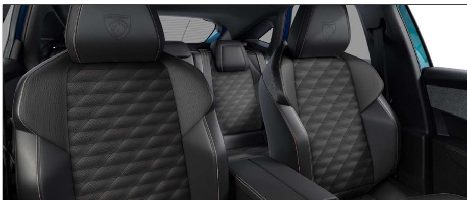
4HFX - Notranjost iz usnja 'Nappa' Mistral Opcija na Allure in GT