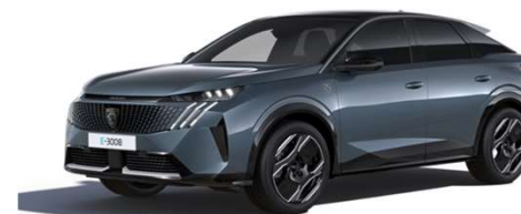
7KM0 - MODRA INGARO