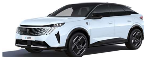
SUM0 - BELA OKENITE