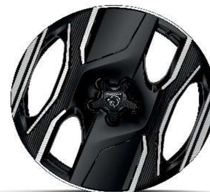
Serijsko na nivoju opreme e-GT 20" ALU platišča 'SOFIA'