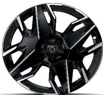
Serijsko na nivoju opreme ALLURE in GT 19" ALU platišča 'BREDA'