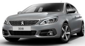
F4M0 - SIVA ARTENSE