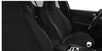
1UFJ - Opcijsko na GT in serijsko na GT Pack - kombinacija usnja in alkantare