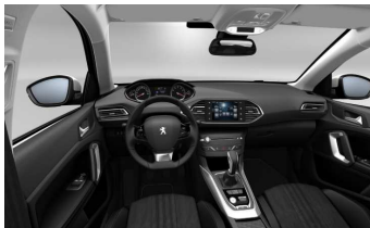
1UFX - Opcijsko na Allure Pack - TEP / Alkantara