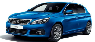
SMM6 - MODRA VERTIGO