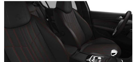
8DFJ - Opcijsko na GT in GT Pack - Usnjena notranjost