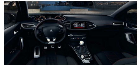
0NFJ - Serijsko na GT Kombinacija TEP in tkanine OXFORD