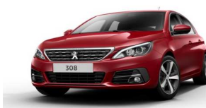
F3M5 - RDEČA ULTIMATE