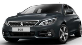
VLM0 - SIVA PLATINIUM