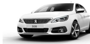
WPP0 - BELA BANQUISE