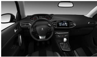
67FX - Active in Active Pack tkanina temna notranjost

• = Serijska notranjost o = Opcijska notranjost / = ni na voljo