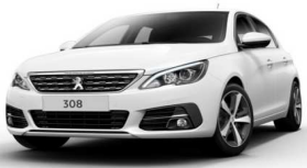
N9M6 - BELA NACRE