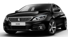
9VM0 - ČRNA PERLA NERA