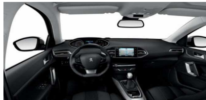
66FX - Allure in Allure Pack tkanina in umetno usnje TEP - MISTRAL ČRNA