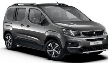
VLM0 - SIVA PLATINUM