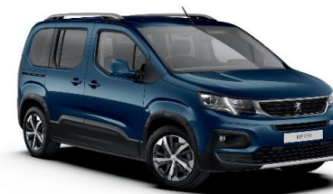
JGM0 - MODRA DEEP