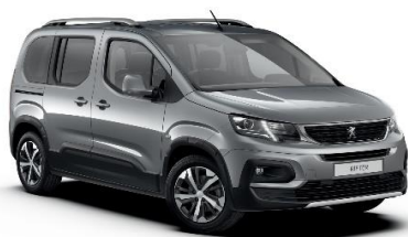
F4M0 - SIVA ARTENSE