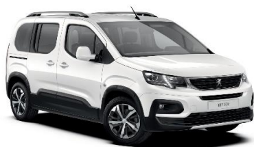
PRP0 - BELA ICY