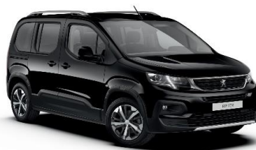
9VM0 - ČRNA PERLA NERA