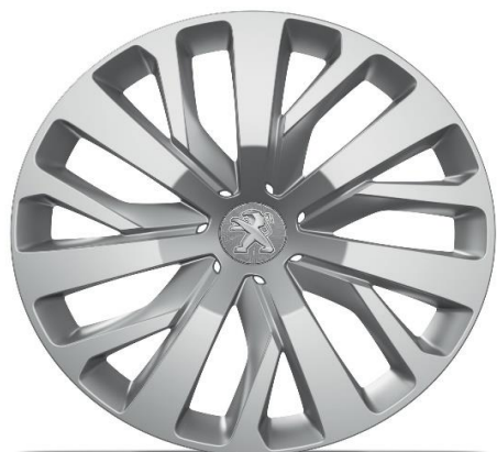
Serijsko na nivoju opreme ACTIVE PACK 16" jeklena platišča z okrasnimi pokrovi 'RAKIURA'